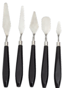
Espátula de pintar