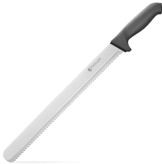
Cuchillo de sierra pastelero