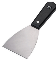
Espátula de repello