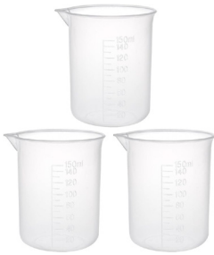
Vasos medidores de plástico