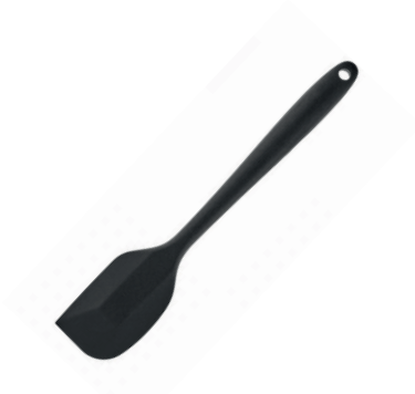
Espátula de silicona