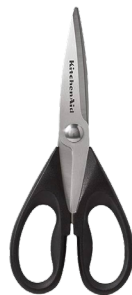
Tijeras de cocina