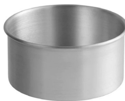
Moldes de aluminio