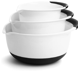
Tazones con agarre