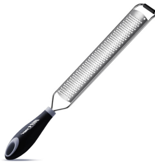
Rayador de zesto