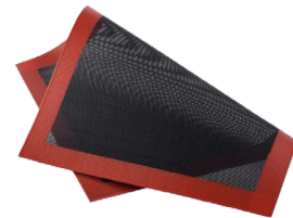
Tapete de silicona