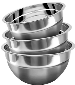
Tazones de acero